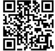
自然の家携帯サイト QRコード